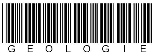
Code 39 codering van het woord GEOLOGIE.

Code 39 is een techniek voor het opstellen van barcodes die in 1974 door Dr. David Allais and Ray Stevens werd ontwikkeld voor het bedrijf Intermecc. Bij code 39 wordt elk karakter voorgesteld door vijf verticale zwarte streken, die van elkaar worden gescheiden door vier verticale witte streken. Drie van deze negen streken zijn breed en de andere zes zijn smal. Barcodes van opeenvolgende karakters worden steeds van elkaar gescheiden door een smalle witte strook. Onderstaande figuur illustreert hoe het woord GEOLOGIE eruit ziet als code 39 barcode.